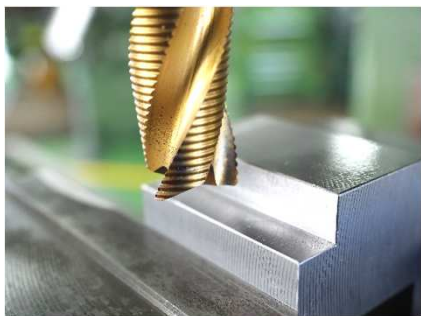
フライス盤による 段付け加工